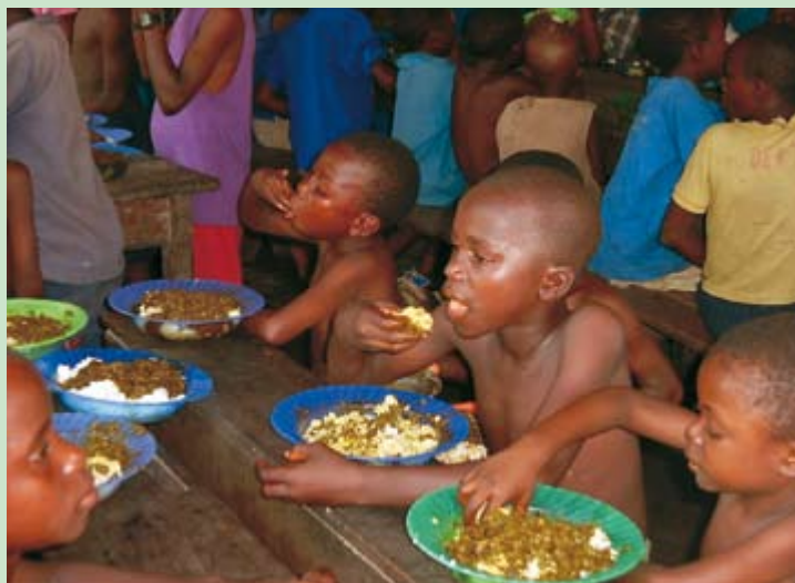
Finalmente il momento del pasto giornaliero!

Un nuova forma di impegno promossa da A.P.I.Bi.M.I. è lo svolgimento di un periodo di servizio di volontariato in situazione in cui l'Associazione è già attiva. In questi mesi ben cinque giovani del Basso Sarca stanno compiendo questo prezioso servizio; la loro esperienza, oltre che ad essere utile per chi ne fruisce, servirà a maturarli e a renderli cittadini del mondo più consapevoli. Essi stessi poi diventeranno agenti di sensibilizzazione nel mondo giovanile; opera che vede impegnata A.P.I.Bi.M.I., in collaborazione con altri enti e associazioni, nelle scuole.