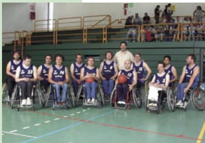
La squadra dell'Albatros

aiuterà ad organizzarci meglio sul piano dell'accoglienza. Fare tutto ciò rientra, fra l'altro, nella nostra filosofia che recita: Scelte di mercato - cultura delle persone".