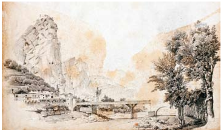
Arco con ponte sul Sarca, Basilio Armani, seconda metà del XIX secolo, Castello del Buonconsiglio, Trento

stimonianza di un lavoro altamente professionale ed accurato.