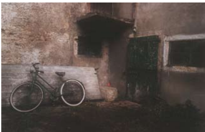
Sotto: "ANTICHITA' DI QUARTIERE" 2° classificato (Scuole elementari) Giulia Merighi - Cl.III scuola el. di Nago