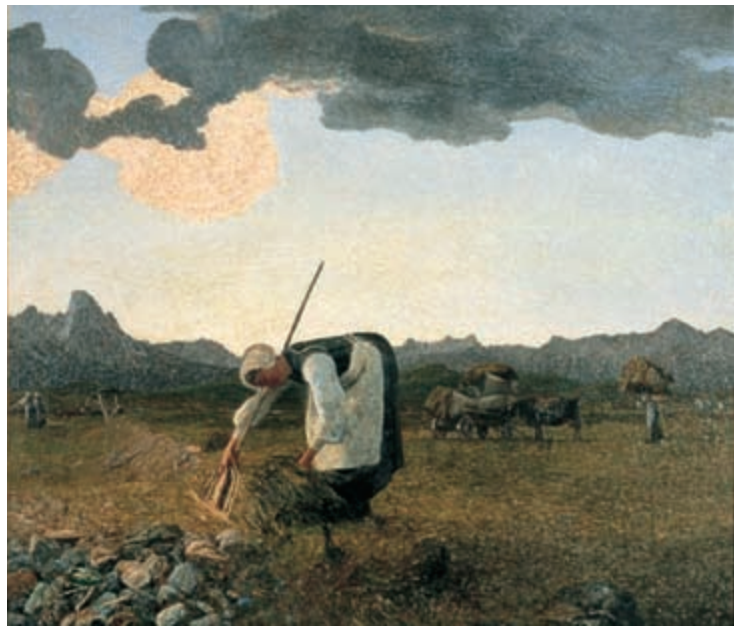
"La raccolta del fieno", 1889 Olio su tela Segantini Museum, St. Moritz Svizzera.

Durante il mese di luglio, nell'ambito degli appuntamenti previsti dalla manifestazione "I suoni delle Dolomiti", si terrà, nello splendido scenario di Malga Campo ai piedi del monte Stivo, un concerto del pianista Ludovico Einaudi. Il noto musicista, accompagnato dall'orchestra "I virtuosi italiani", proporrà al pubblico la composizione "Panorama-Divenire" ispirata al Trittico pittorico "La vita, la natura, la morte" di Giovanni Segantini. Vi saranno poi, sempre durante l'estate, spettacoli teatrali che presenteranno aspetti particolari della vita del grande pittore.